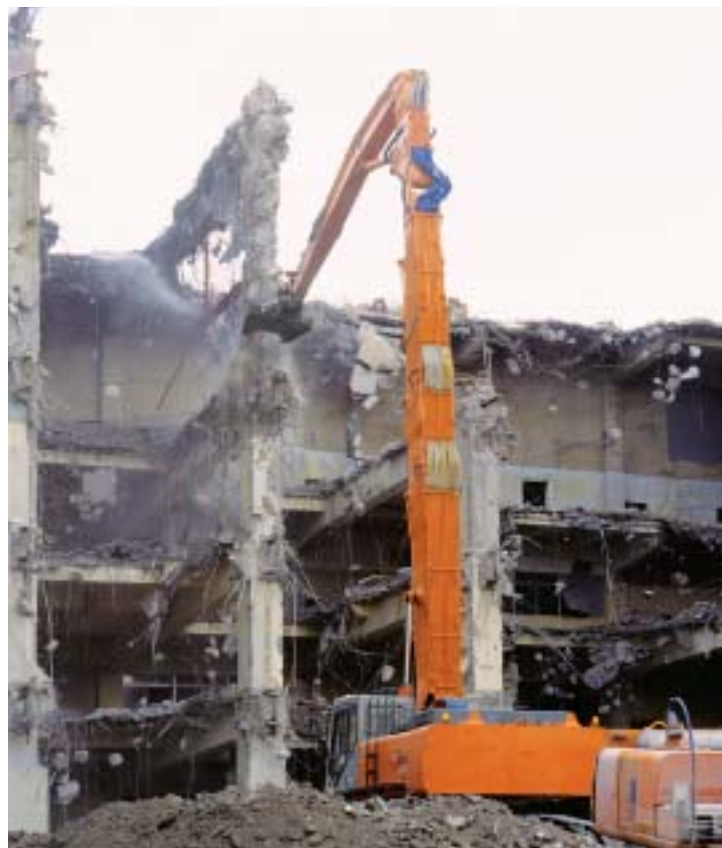
照片所示为 ZAXIS450LCH 型机器。该型式破碎剪可安装于高空拆除机。